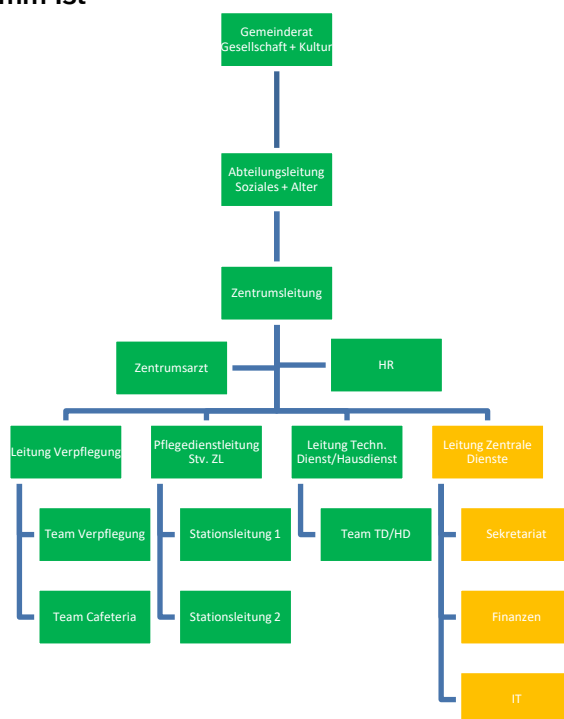
Abb. 1: Organigramm Ist

Am 1. September 2019 genehmigte der Gemeinderat die Organisationsänderung im Alters- und Pflegezentrum Breiti (APZ) und das Geschäftsleitungsmodell wurde eingeführt. Dies nach einer Organisationsanalyse durch einen externen Anbieter. Dabei wurde insbesondere die Schaffung der Bereichsleitung „Zentrale Dienste“ beschlossen. Diese sollte sämtliche administrative Aufgaben übernehmen. Mit der neuen Bereichsleitung sollte die Administration weiter professionalisiert, Synergien genutzt, die Stellvertretungen im Bereich Finanzen und HR besser geregelt, die Prozesse optimiert und die Zentrumsleitung entlastet werden. Dadurch soll sich die Zentrumsleitung sowie die neu formierte Geschäftsleitung mehr Zeit für die Führung der Mitarbeitenden und die Entwicklung und Verbesserung der Prozesse im APZ nehmen. Für die Umsetzung fehlte die Stelle der Leitung Zentrale Dienste, welche man im Anschluss zu rekrutieren versuchte.